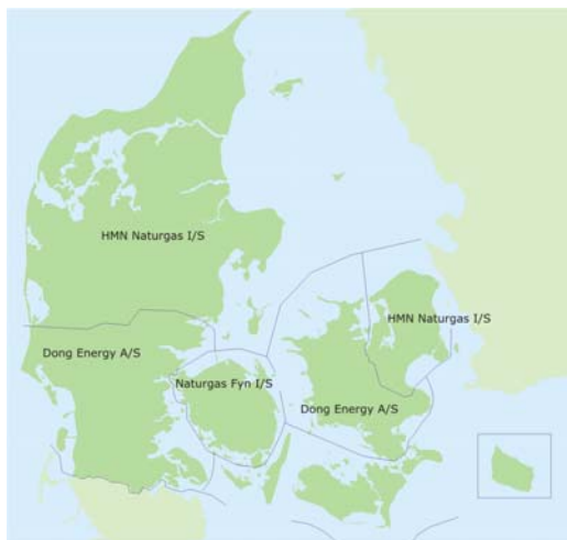
Figur 11 Gasdistributionselskaber.

Anlægssamarbejdet mellem Energinet.dk og distributionselskaberne foregår primært bilateralt.