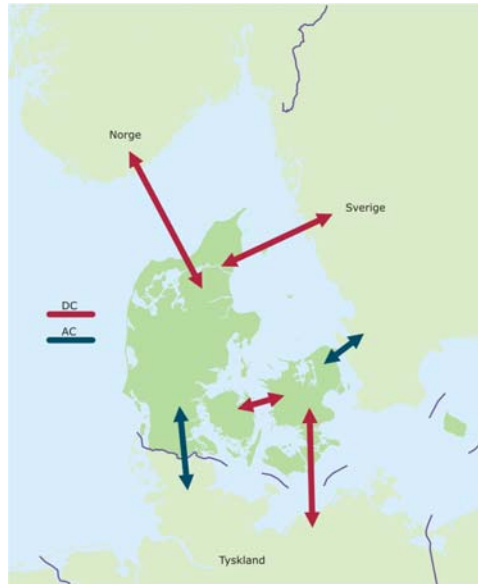
Figur 6 Eksisterende samkøringsforbindelser 2011.

Sjælland og Fyn er forbundet med en 600 MW HVDC-forbindelse over Storebælt.