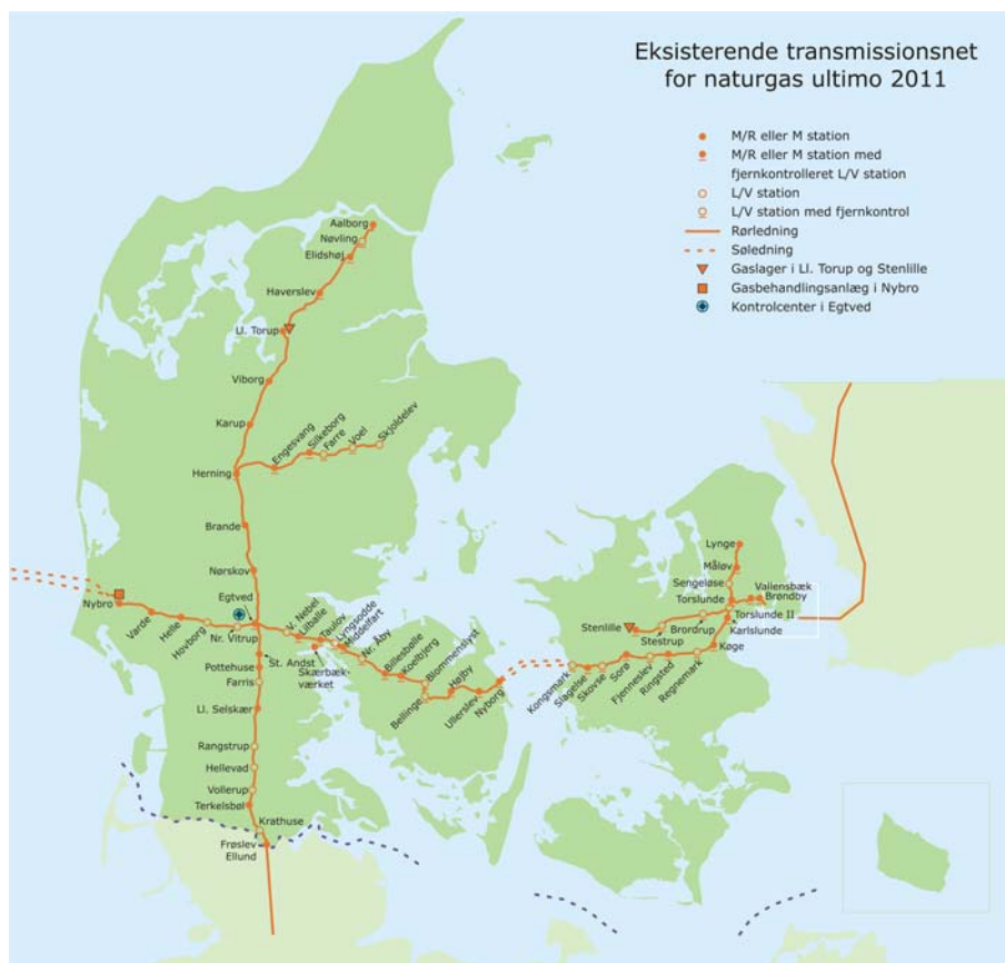
Figur 10 Eksisterende gastransmissionsnet 2011.

Energinet.dk ejer gastransmissionsnettet på land og naturgaslageret i U. Torup. Gastransmissionsnettet har en samlet udstrækning på ca. 800 km.