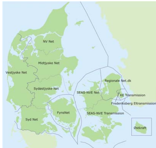
Figur 9 Regionale transmissionsselskaber.

Som foreskrevet af elforsyningsloven stiller transmissionsselskaberne deres net, der er drevet ved spændinger over 100 kV, til rådighed for Energinet.dk. Det inkluderer transformere, der forbinder transmissionsnettet til net på lavere spændingsniveauer.