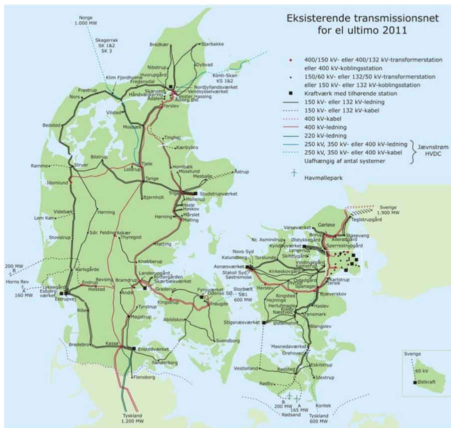
Figur 7 Eksisterende transmissionsnet 2011.