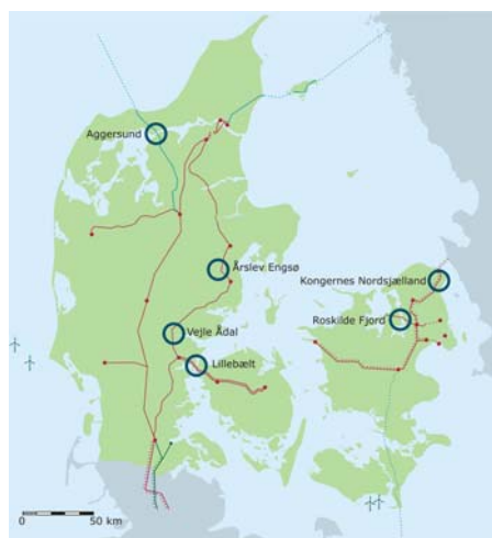
Figur 4 Seks områder i Danmark er udpeget til forskønnelse.

I Forskønnelsesplanen for 400 kV-nettet blev seks områder med 400 kV-luftledninger anbefalet forskønnet, Figur 4.