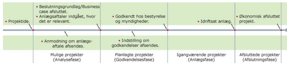
Figur 1 Projektfaser og deres overgange.

Projektstatus og deres overgange fremgår også af Figur 1.