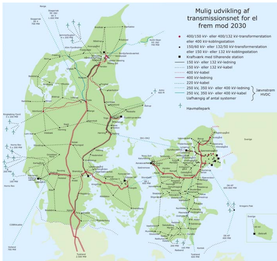
Figur 8 Den langsigtede netstruktur for eltransmissionsnettet.

Som udgangspunkt bliver det øvrige 400 kV-luftledningsnet stående, men der gennemføres forskønnelsesprojekter i form af udskiftning til nye mastetyper, omlægning af tracé og delvis kabellægning.